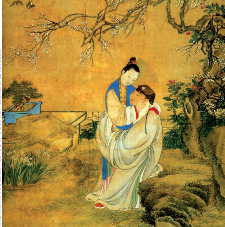
Anonyme, fin XVIIIe siècle, encre et couleurs sur soie.