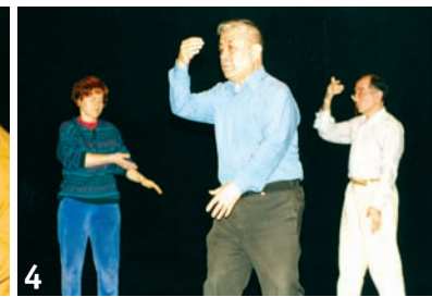
3 dans le paysage social français. Le Directeur des échanges internationaux de l'UNESCO, Doudou Diene, parraine cette première manifestation (4) , ou Tong Jue Shiang (4) .