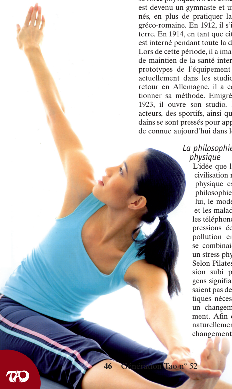
Photo extraite de l'ouvrage « Pilates, 15 minutes chaque jour » par Alycea Ungaro, Le Courrier du livre