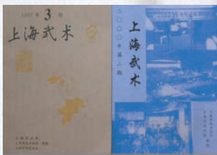
Magazines de wushu de Shanghai où parurent les articles de Wan Wen De révélant les confusions dans l'histoire du style Chen.

Pour en savoir plus, consulter le carnet d'adresses P. 62.