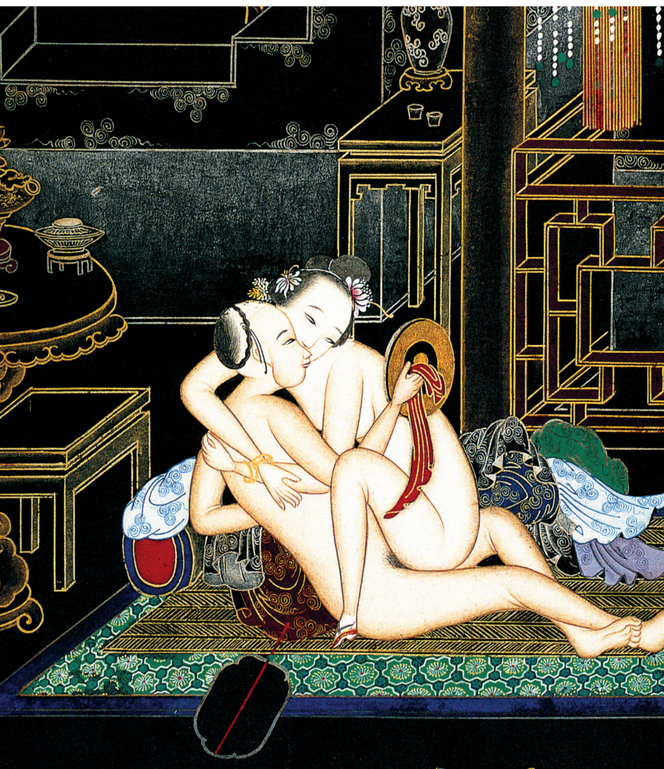
crédit photo: L'art d'aimer à la chinoise, par Liao Yi Lin, publié aux éditions de la Marinière.

On retrouve dans les pratiques taoïstes beaucoup de préoccupations axées sur la pratique de la rétention ou de la suspension du sperme. Les taoïstes expriment cela très bien en parlant de remplacer « l'éjaculation par l'injaculation » et de faire remonter l'énergie du sperme vers le cerveau pour le nourrir — comme l'a d'ailleurs fort bien décrit Yves Réquena — . Mais si toutes ces techniques peuvent avoir un réel intérêt, il est important de se rendre compte que pour éveiller le plaisir chez la femme, le contact de la peau demeure très important. La main, qui comprend 30000 terminaisons nerveuses, et la peau se révèlent dans les relations amoureuses être un véritable et essentiel moyen de communication. Toucher par la main permet autant de transmettre et de capter les émotions. C'est une entrée en matière avec l'autre. Savoir masser et savoir caresser détend, change la respiration et permet d'intérioriser. Nous avons une fâcheuse tendance à oublier que cette dimension peut être plus importante que la pénétration. Le tactile est un moyen essentiel pour amener la femme au plaisir. Je le répète, la main, avec ses terminaisons nerveuses, ses 26 muscles et ses 27 os est le premier vecteur du plaisir. La sexualité, c'est entre autre, l'art de se servir de ses mains pour développer le plaisir. Depuis l'avènement de la pilule, les femmes ont découvert le droit à avoir du plaisir. Savoir développer le plaisir permet de