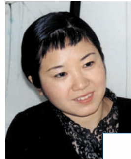
Shan Sa, calligraphe et auteur

Ji Gong, appelé le moine fou. Parce que le Taoïsme, contrairement au Confucianisme, n'a pas de norme. C'est un principe. Ji Gong était un moine taoïste qui ne suivait pas les préceptes du monastère, mais répondait à ses propres impulsions, dans l'instant. Dans ce sens, c'était un vrai Taoïste.