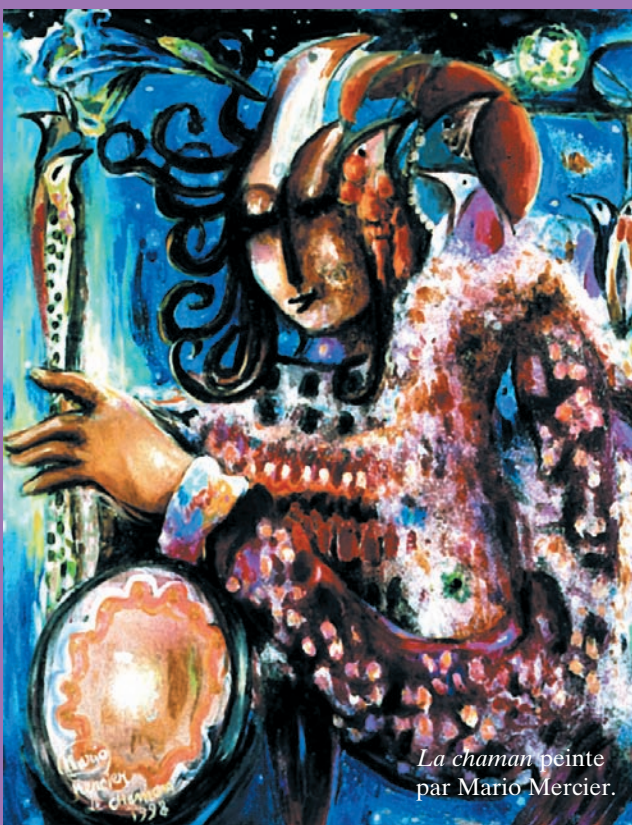
La chaman peinte par Mario Mercier.

(...)Le chamanisme donne à l'homme la possibilité de pénétrer dans ces espaces (sortes de frontières spirituelles vibratoires), d'en explorer la dimension pour en extraire un enrichissement spirituel. Spécialiste de la "rupture des niveaux", le chaman supprime les frontières apparemment fermées des apparences. Par sa fonction d'intermédiaire sacré entre le Ciel et la Terre, il nous apprend l'art du déplacement et de la métamorphose. L'extase est son meilleur moteur.