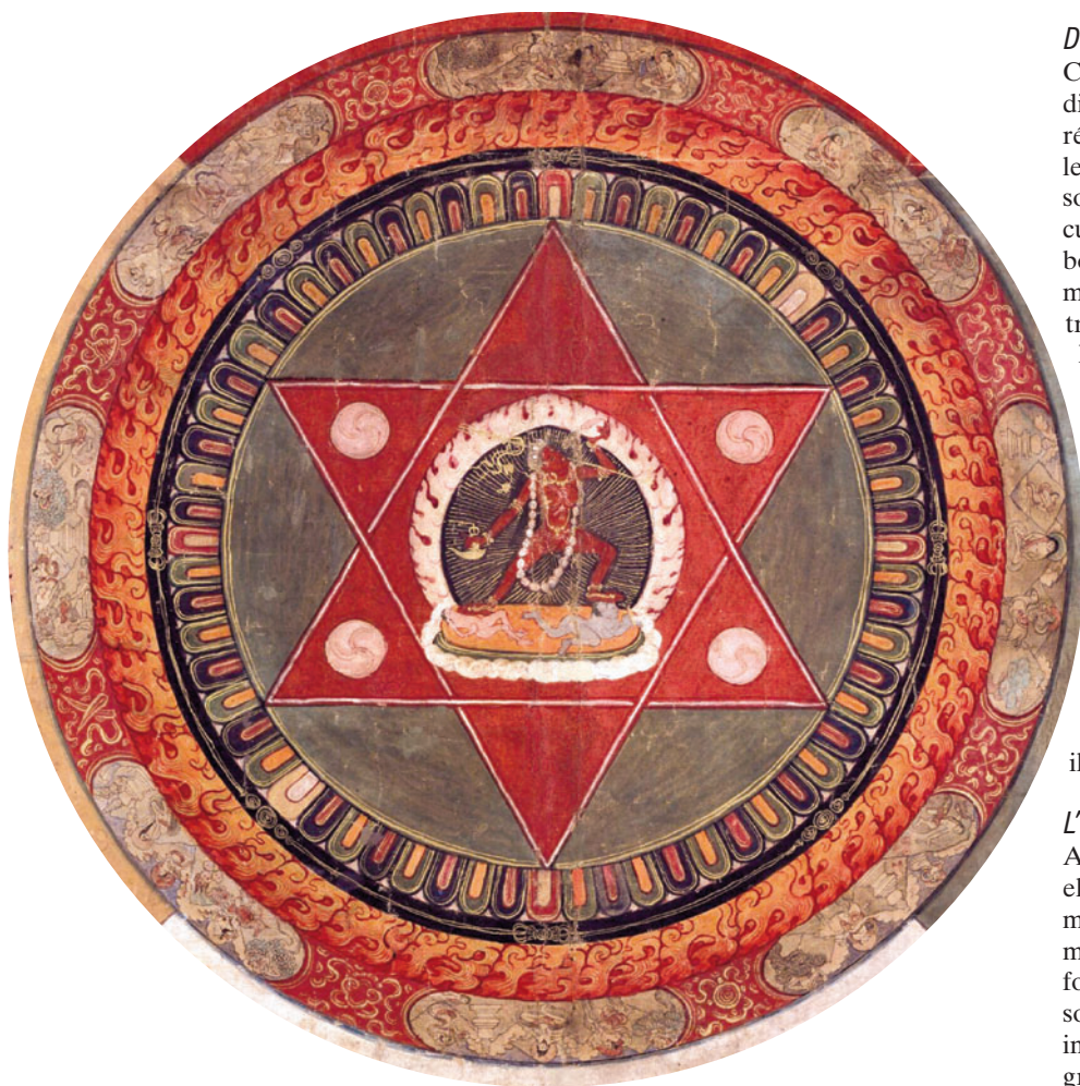
Peint au 19 e siècle, le mandala tibétain de Naropa.