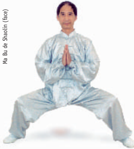
Ma Bu de Shaolin (face)