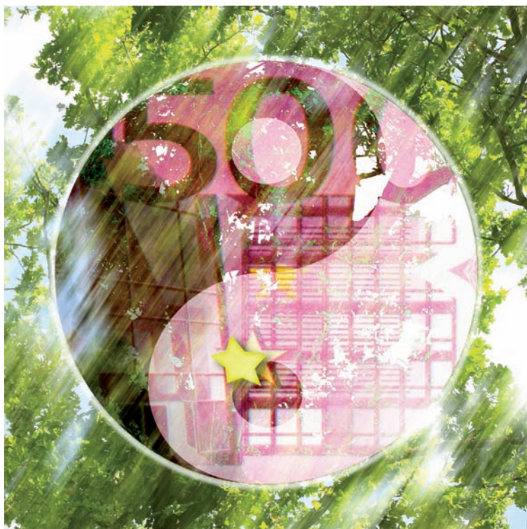
Illustration : Frédéric Vilbrandt