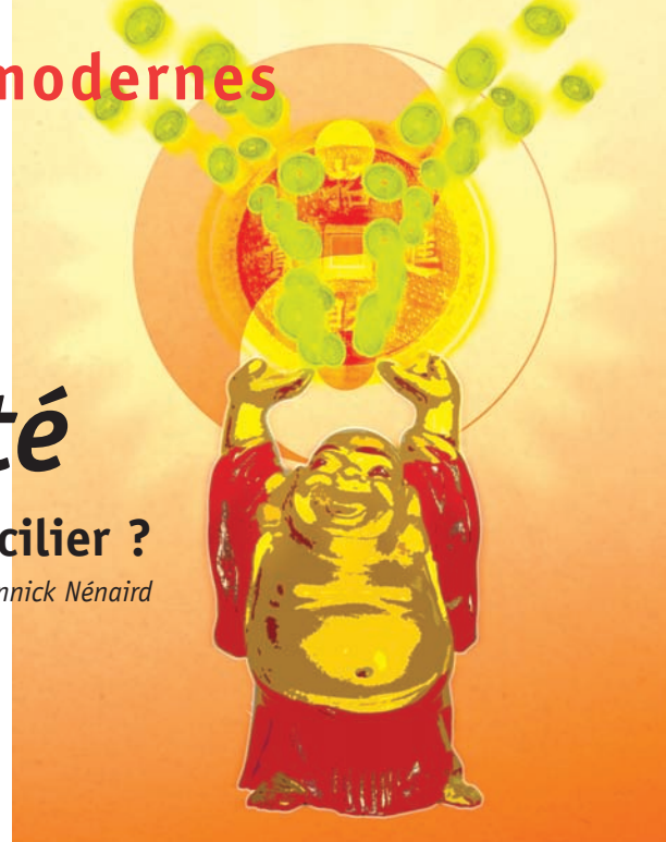
Illustration : Frédéric Villbrandt

La spiritualité existe aussi en dehors des religions, pour certains, ce serait : « Comment devenir chaque jour une meilleure person-