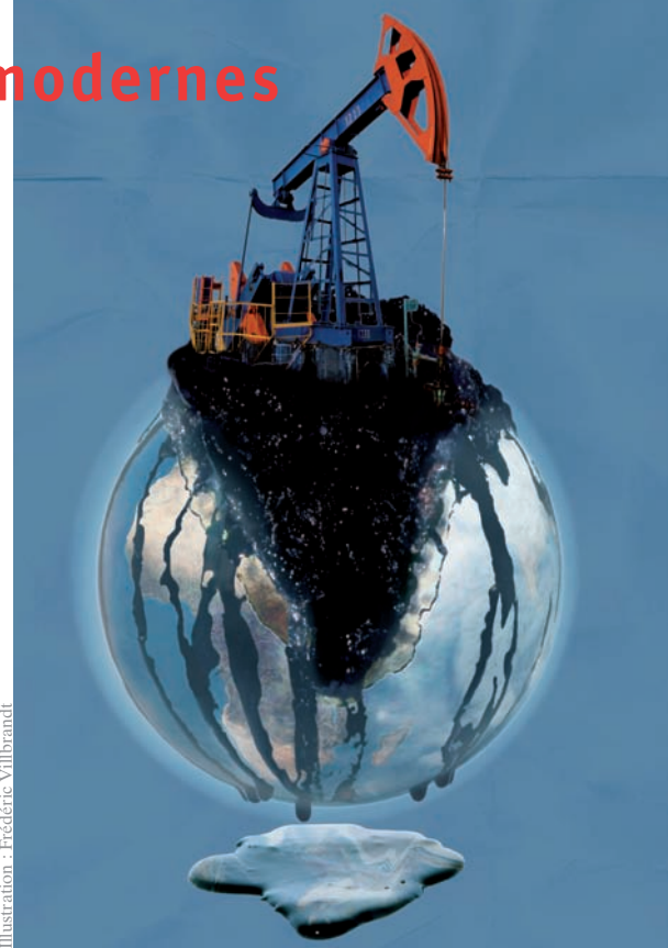
Illustration : Frédéric Villbrandt

Car en fait, comment peut-on dire par exemple qu'il existe un problème de l'emploi dans le monde dès lors qu'il y a d'un côté un immense champ de besoins essentiels encore insatisfaits, et de l'autre des centaines de millions de chômeurs, compétents, littéralement « mis au rebut » à cause du « marché » ? Il y aurait un réel problème de l'emploi s'il n'y avait plus aucun besoin à servir, ou bien plus assez de ressources humaines disponibles. Non, nous l'affirmons, il n'y a pas de problème de l'emploi mais problème de financement de l'emploi ! C'est bien différent. Et de même en est-il de presque toutes les autres questions qui se posent à nos sociétés, depuis le « trou » de la sécu jusqu'à la lutte contre les pandémies, en passant par l'éducation et l'accès à l'eau. En fait, si on se donne la peine de regarder les choses de près, on se rendra compte qu'il exis-