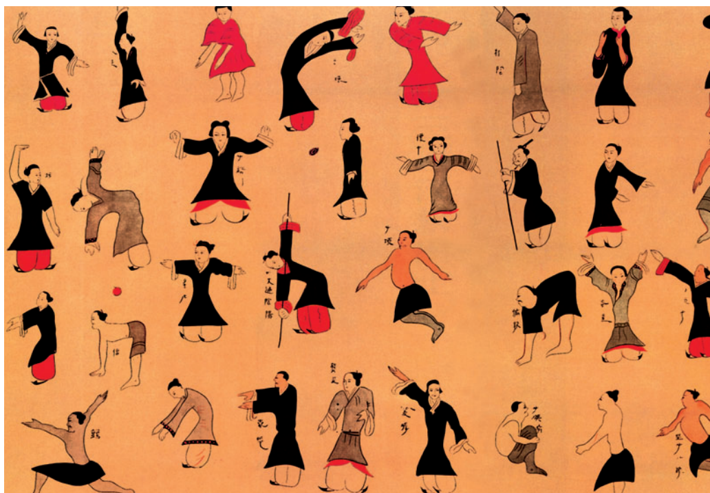
La bannière Ma Wang Dui est une peinture sur soie représentant 44 postures de Dao Yin.