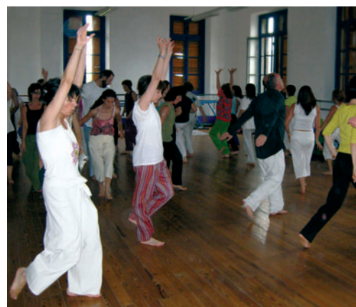
Pratique de la libération de la voix.

le cosha le plus léger compénètre le plus dense. Les flux de conscience sont les vibrations qui véhiculent les échanges entre les coshas. Par effet de densification, ces flux à l'origine éthérés deviennent pensées, émotions et énergies. Lorsqu'il y a un conflit intérieur, une engrammation se fixe dans le corps d'éther, crée un nœud émotionnel qui désorganise le flux énergétique et encombre le réseau des nadis et des méridiens. Ainsi les désordres de l'inconscient conduisent à la naissance de maladies psychosomatiques qui apparaissent peu à peu dans le corps physique dense.