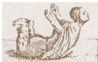
Ill.: Dailly, céstologie, 1859.

Aurait-on oublié de mentionner que la pratique du Qi Gong se trouve à l'origine de la gymnastique sportive occidentale ?