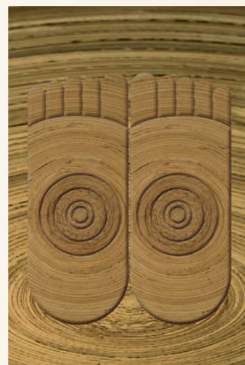
Illustration : Imanou Risselard

Rétablir la bonne circulation d'énergie.