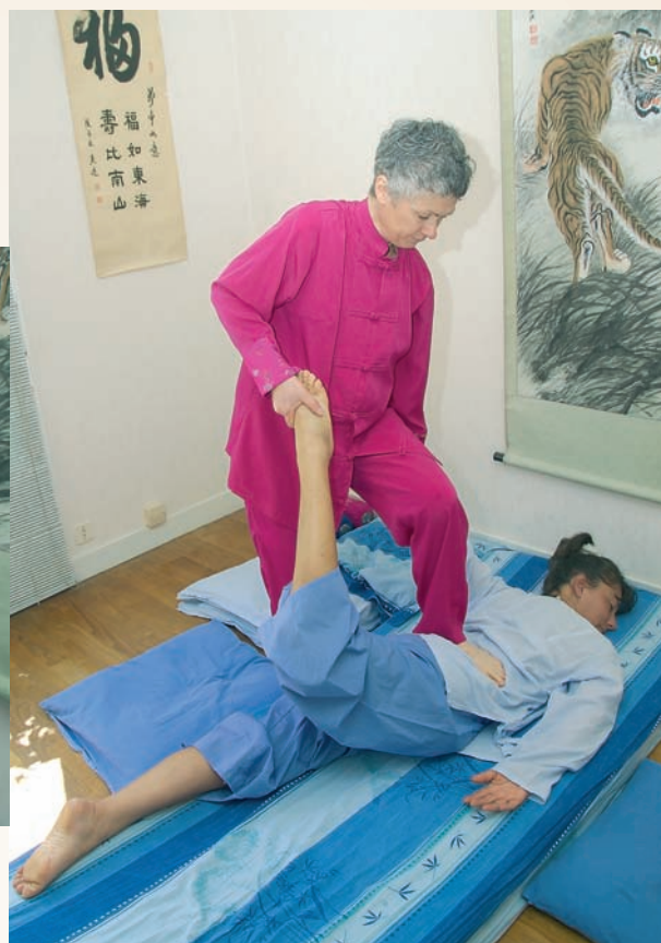
Etirement en croix de la chaîne antérieure.

particularités de ce massage. C'est notamment pour cette raison qu'il est appelé «yoga des paresseux» ; ils donnent au receveur une grande sensation de souplesse grâce au travail des tendons et des ligaments.