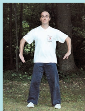
Posture n° 2