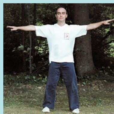
Posture n° 4