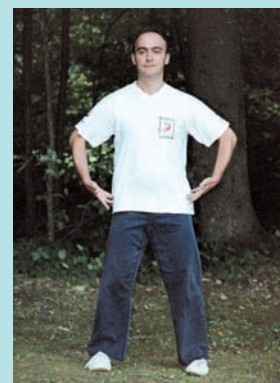
Posture n° 3