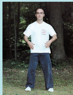
Posture n° 1